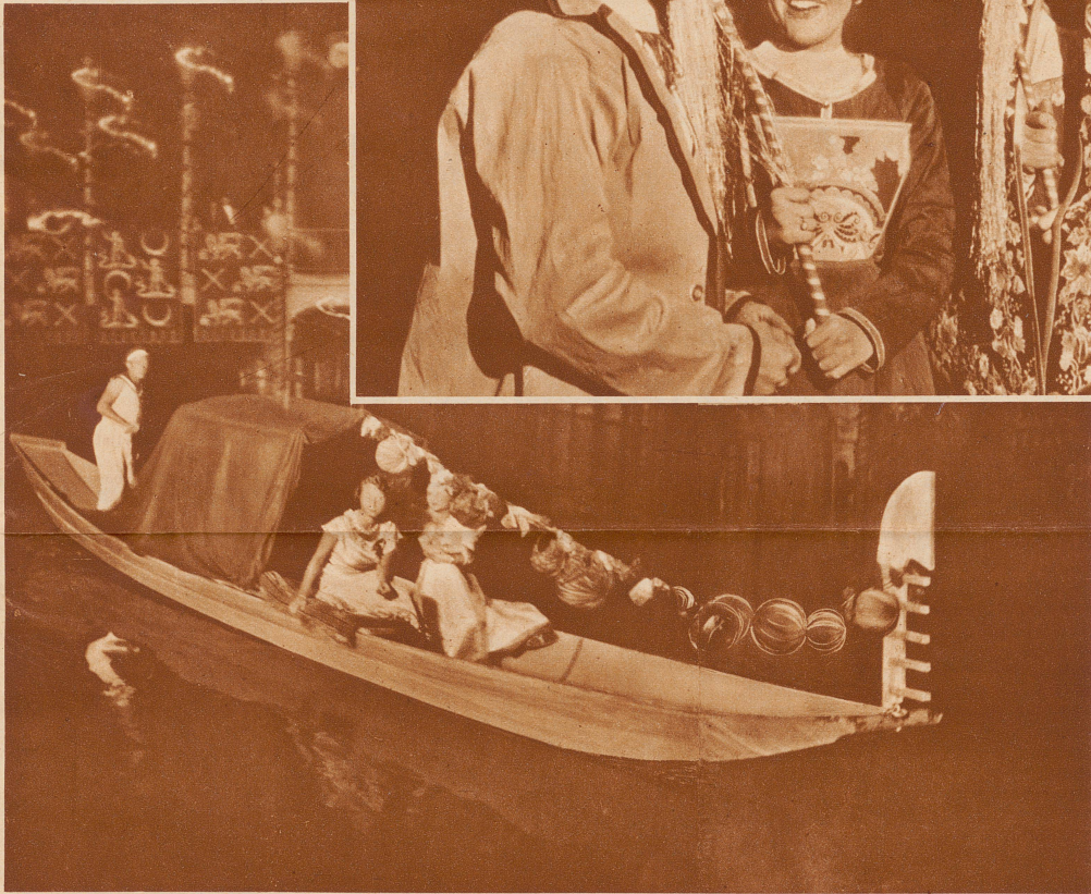
Venezianerinnen! Wer spräche ohne Schwärmerci von ihnen?

Der nüchterne Schanzengraben — in manchen architektonischen Projekten Zürichs bereits zugeschüttet und zur Autostraße geworden —, nun dieser Schanzengraben hat ein nie geahntes Gesicht gezeigt. Er gab sich plötzlich echt venezianisch. Lampions, Gondeln, Wasserspiele, Tenöre, Mandolinen, schöne Frauen, Brücken, Tänze, Farben — Sommernachtszauber, daß die Zuschauer draußen auf den Zürcher Straßen bis tief in die Nacht hinein stillstanden und in diese Zauberwelt hineinschauten.