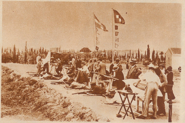
Schützenfest der Schweizerkolonie in Athen. Wo immer im Ausland größere Schweizerkolonien bestehen, da ist bestimmt auch ein Schützenverein zu finden. Auch losgelöst vom heimatlichen Boden hängt der Schweizer leidenschaftlich an seinem Nationalsport und sucht ihn auszuüben - wo er nur kann. Das muß zuweilen unter sehr primitiven Verhältnissen geschehen, denn nur ganz wenige Schweizerkolonien im Ausland verfügen über so komfortable Schützenhäuser, wie sie fast jedes Dörfchen in der Heimat besitzt. Unser Bild zeigt einen Ausschnitt des Schützenstandes von Pankrati bei Athen beim diesjährigen Schützenfest der Schweizerkolonie