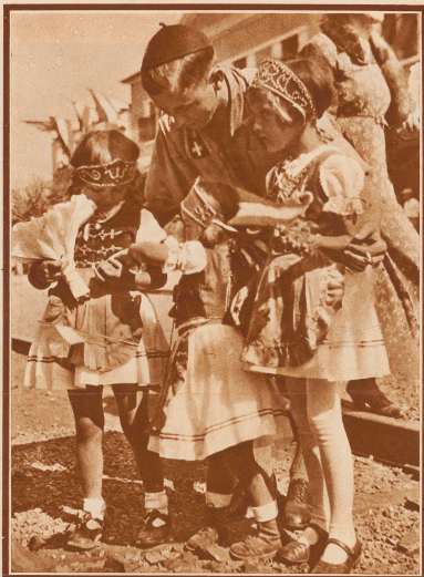
Schon an der Grenzstation erwarten uns allerhöchste kleine Ungarnmädchen in Nationaltracht mit Blumen und Lebkuchenherzen

Jamboree... was will das Wort eigentlich bezeichnen? Hingebildet wurde es von Begründer und Führer des Weltpfadfinderverbandes, Lord Baden-Powell, und ist heute jedem Pfadfindervolk bekannt. Ursprünglich bedeutete es einen indischen Jahrmarkt. — Und auf den ersten Blick mag unser Lager wohl etwas den Eindruck eines solchen indischen Jahrmarktes machen: Tausende von Zelten, aber Tausende von Burschen und jungen Männern aller Länder und Rassen, ein bunte, buntes Sprachengewirr... aber alles beherrscht durch ein Wollen, ein Zusammengehörigkeitsgefühl.