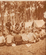
Die Schweizergruppe an ihrer Mittagstisch. Jeder Stamm sucht für sich etwas ab, aber stets sind Güter gerne gegeben