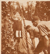
Die neuesten Lagerbeble werden an der Anschlag-Heute befestigt, wo sie jeder ersehnter Kunst