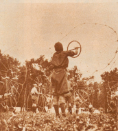
Die ungarischen Pfadfinderbrüder unterrichten uns in Solbräudchen