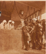
Ungarwurst und Paprika