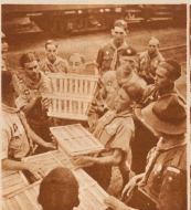
Jeden Montag muß die Verpflegung durch einen Trupp Pfad für den kommenden Tag gefaltet werden