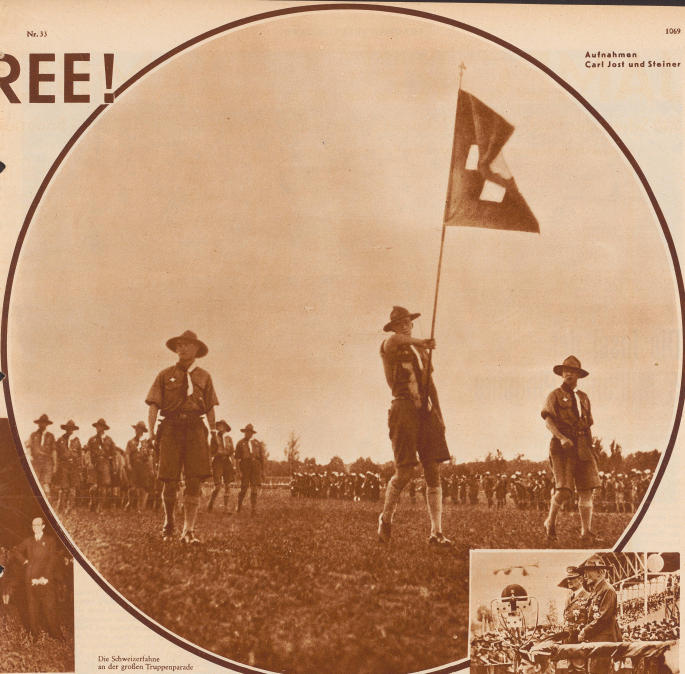
Die Schweizertruppe an der großen Truppenparade

danken und gemeinsamen Zielen haben sie sich zusammengefunden. Sir Baden Powell hat genau gewußt, was er tat, als er eine Verständigung der Rassen gerade bei den J u n g e n zu planen beabsichtigt war; er hat richtig geurteilt, seine idealen Ziele haben sich fester gesetzt und sitzen in den 30 000 Pfadfindern, die sich hier in Ungarn zusammen-