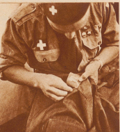
Jeder Lagerzeltbewohner erhält ein Abzeichen, das den apostrophischen, ungarischen Wundschreiben darstellt, und die er selbst — ob Führer oder einfacher Pfad — auf sein Hemd nähen muß

Uns Schweizern fällt es nicht schwer, uns in die Weltpfadfindergemeinschaft hineinzufinden. Gleich vom Anfang an gemessen wir mit unseren «Mälderchäppli» Lagermützen große Sympathien, und heute laufen Schweizer, Siamesen, Amerikaner und Aggreyer mit dem Schweizer-Mälderchäppli herum.