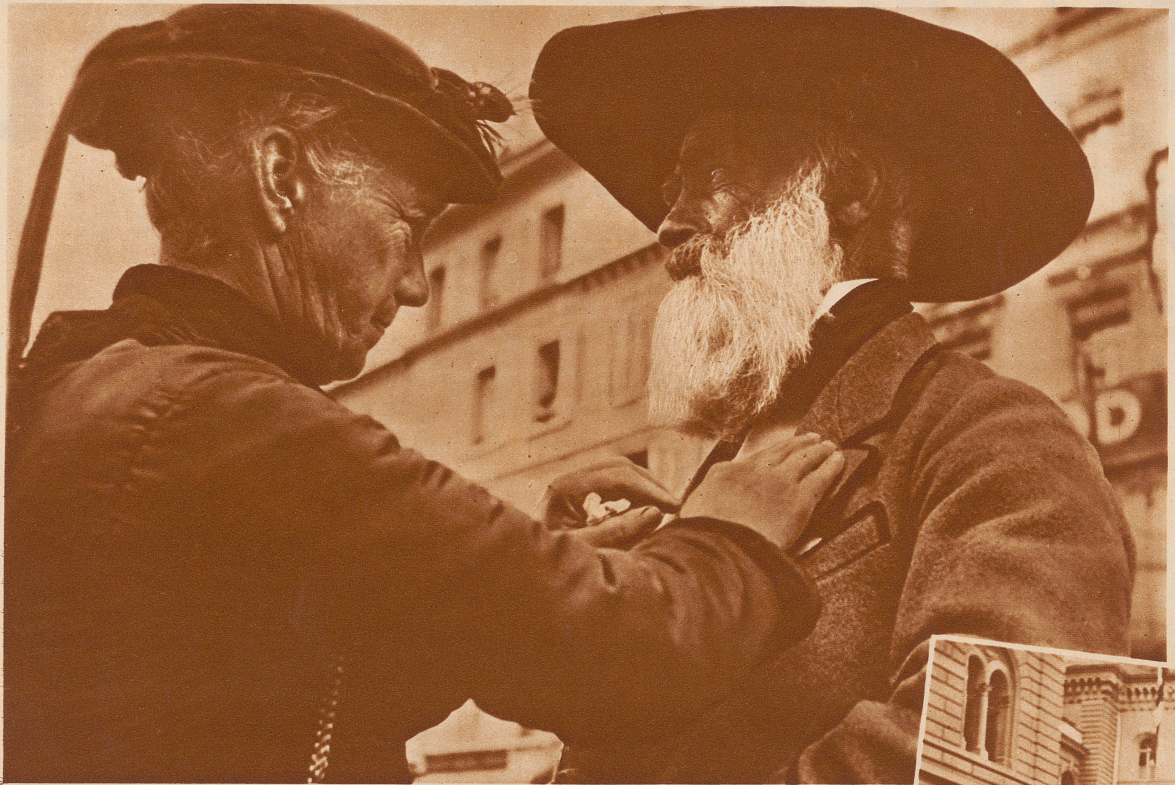
Aus allen Zipfeln des Bernerlandes kamen Schützen und Nichtschützen zur Jahrhundertfeier des Kantonalverbandes in der Bundeshauptstadt zusammen. Viele Festteilnehmer stellten sich in ihren Trachten ein. Bild: Das Guggisbergmüeti ordnet dem alternden Simishansjoggeli den Festtagskragen