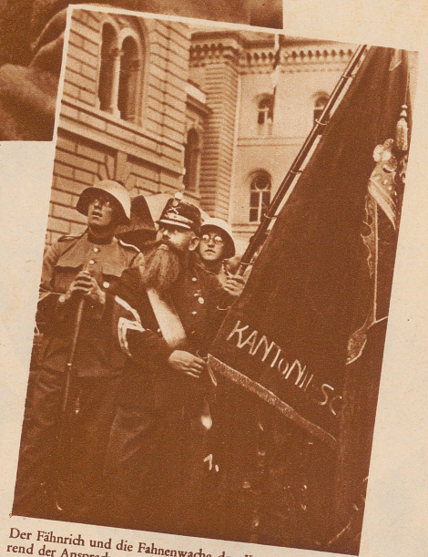
Der Fähnrich und die Fahnenwache der Kantonalflagge während der Ansprache von Bundesrat Minger