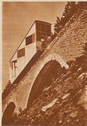
Neue Seilbahn in den Alpen. Am 19. August wurde die jüngste schweizerische Bergbahn von Schwyz auf den Stoos eingeweiht und dem Betrieb übergeben. Die Bahn weist eine Maximal-Steigung von 78 1/2 auf und ist somit die steilste Touristen- und Sportbahn der Schweiz. Sie überwindet in 12minütiger Fahrt eine Höhendifferenz von 750 Meter. Durch diese Linie ist ein schönes Sommerkurgebiet und ideales Skigelände der Zentralschweiz dem Verkehr erschlossen worden