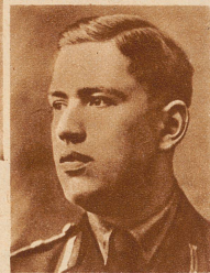
Franz Hofer , der nationalsozialistische Gauleiter des Gaues Tirol wurde von Gessinnungsfreunden gewaltsam aus dem Innsbrucker Gefängnis befreit. Er floh nach Italien und flog von dort aus nach Nürnberg, um an der Tagung seiner Partei teilnehmen zu können