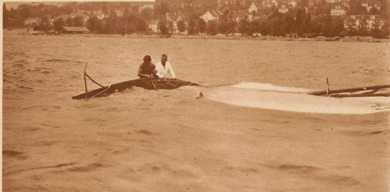
«Nelly III vom Attersee» ist gekentert. Bei der Internationalen Jollenregatta auf dem Zürichsee wurde ein schwerer Westwind dem österreichischen Boot zum Verhängnis