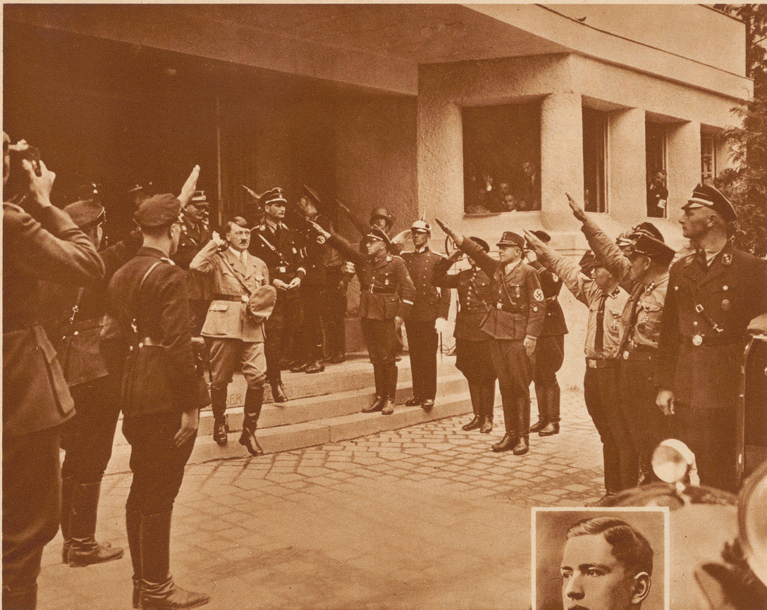
Nationalsozialistische Tagung in Nürnberg. Während des großen Treffens der deutschen Nationalsozialisten in Nürnberg hielt Hitler eine große Rede, die als wichtige partei- und staatspolitische Proklamation angesehen wird. Bild: Der Reichskanzler verläßt nach seiner Rede die Luitpoldhalle. Hinter ihm, links, der Stabchef der S. A., Röhn, rechts der Stellvertreter des Parteiführers, Rudolf Heß