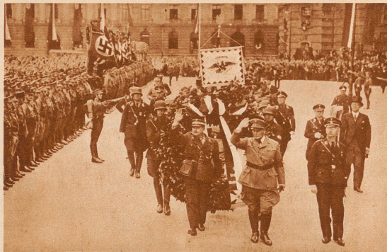
Die Eröffnung des preußischen Staatsrates. Am 15. September fand in der Berliner Universität die Eröffnungssitzung des von Ministerpräsident Goering geschaffenen preußischen Staatsrates statt. Dieser Staatsrat, eine rein preußische Angelegenheit, setzt sich zusammen aus 68 Vertretern der Kirche, der Wirtschaft, der Kunst, der Wissenschaft und der Arbeit. Er ist das «höchste und vornehmste Gremium des preußischen Staates». Bild: Stabschef Röhm, Ministerpräsident Goering und S.S.-Führer Himmler begeben sich an der Spitze des Staatsrates zur Kranzniederlegung zum Denkmal Friedrichs des Großen