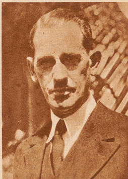
Diktator San Martin. Durch Dekret des Präsidenten San Martin ist die Verfassung von Kuba außer Kraft gesetzt und die Diktatur errichtet worden. Der Ausnahmezustand soll bis zu den Neuwahlen andauern