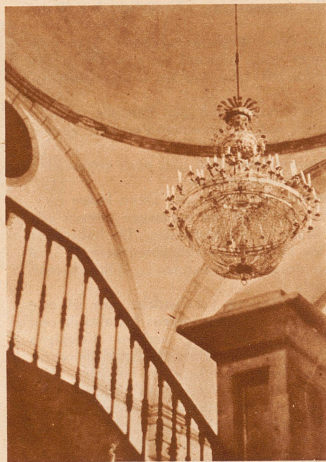
In den verödeten Räumen hängt ein wundervoller Kronleuchter, ein Ueberrest einstiger Pracht