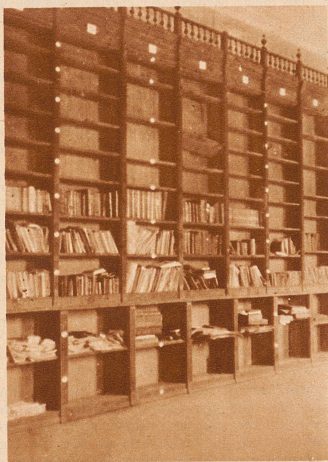
In den Gestellen der Bibliothek sind ein paar lateinische Klassiker zurückgeblieben