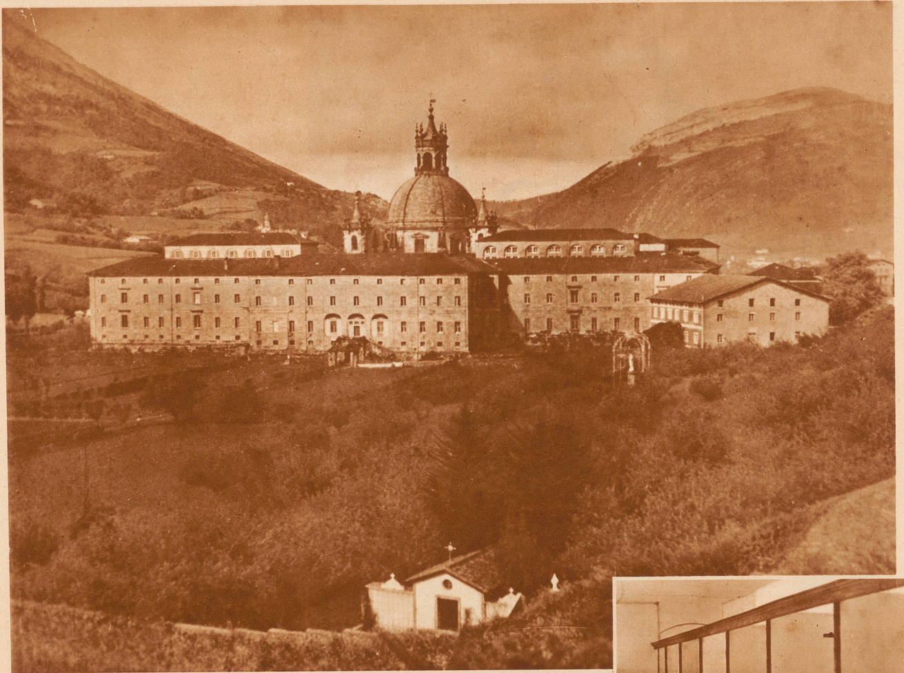
Das Kloster Loyola