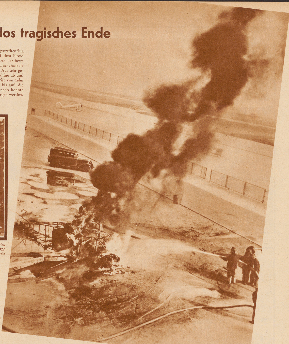
Die Flugplatzfeuerwehr bei der Löscharbeit