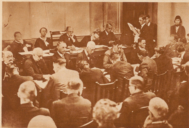
Der Scheinprozess in London. In London tagt jetzt der seit langem angekündigte «Gegen-» oder «Schein-Prozess» um den Reichstagsbrand. Berühmte Rechtsanwälte aus verschiedenen Ländern sind bei dem Prozess beteiligt. Die deutsche Regierung hat in der Sache bei der englischen Regierung ohne Erfolg Protest erhoben. Unser Bild zeigt eine Sitzung der beteiligten Anwälte im Saal der Law-Association