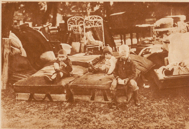
Die Brandkatastrophe von Oeschelbronn. 203 Gebäude, darunter 83 Wohnhäuser, des Ortes Oeschelbronn sind der Feuersbrunst zum Opfer gefallen. 400 von den 1500 Einwohnern sind obdachlos. Menschenleben sind keine zu beklagen. Bild: Gerettete Habe