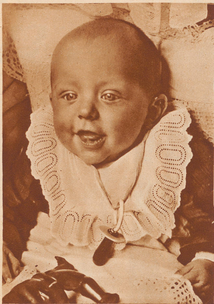
Hindenburgs 25 000stes Patenkind.

Gott sei Dank kommt uns jedes Jahr die Natur selbst zu Hilfe durch einen erbitterten Feind der Fliege: ein in