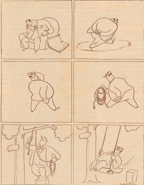
Kleine Geschichte ohne Worte.

«Ja, wenn alle hineingehen, gehen nicht alle hinein. Aber wenn nicht alle hineingehen, dann gehen alle hinein. Es gehen aber nicht alle hinein!»