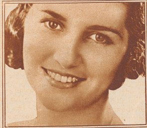
Nur blendend weisse Zähne machen Ihr Lächeln reitzvoll

Der Listerine Zahnpasta sind Grundstoffe beigelegt, welche die Entfernung des Films bewirken und den Zahnschmelz ohne ihn anzugreifen aufs feinste polieren. Ein weite-