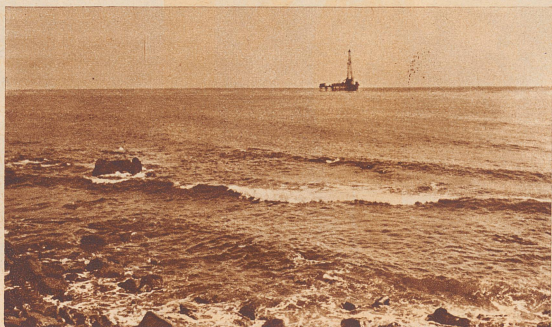
Die produktive Inselbohrung von Rincon-Seacliff, mehrere Kilometer von der kalifornischen Küste entfernt, im Pazifischen Ozean.

Ein altes Ehepaar besaß dort ein kleines Grundstück, wo sich jetzt der Wald von Bohrtürmen dehnt. In Armut und Krankheit war noch der Mann gestorben. Dann kam der Bohrerfolg, und dem Mütterchen wurden monatlich 20 000 Dollar als Produktionsanteil ausbezahlt. So wechselte das Petroleumglück. Auch wenn das herrliche Kalifornien von der Wirtschaftsdepression schwer betroffen wurde, so ist es trotzdem noch heute ein «Land der unbegrenzten Möglichkeiten».