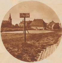
Am Dorfingang von Zürich

Dumme Frage, nicht wahr? Zürich liegt eben da, wo es liegt. Am Zürichsee natürlich! Im Kanton Zürich! In der Schweiz selbstverständlich! — Weiß gefehlt. Unser Zürich, das Zürich von dem wir hier Bilder zeigen, liegt — in Holland, an der Küste der Provinz Friesland, grad am nördlichen Ende des großen Abschlußfaleiches, der zur Trockenlegung der Zuidersee errichtet wurde. — Bilder sind unwiderlegbare Zeugen. Bitte, überzeugen Sie sich — Zürich ist ein holländisches Fischerdorf!