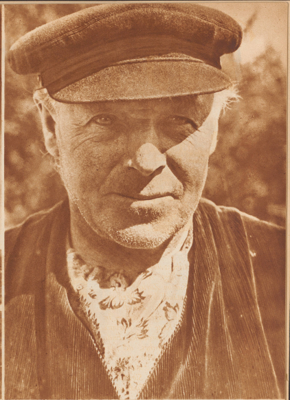
Fischer aus Zürich.