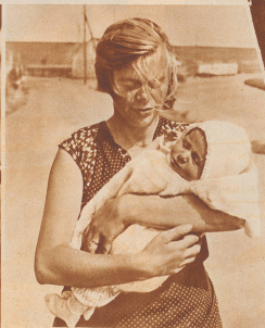
Der jüngste Zürcher Bürger! So befreite er unser photographischer Mitarbeiter. Aber wir haben mit der Veröffentlichung seiner Bilder ein wenig gezögert. Seit der Aufnahme sind ein paar Monate vergangen. Vielleicht ist der oder die Kleine zum unerwarteten Entweihens Zürichs gelangt.