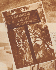
Ein Schild in Zürich. Veiligheid riijchtheid, Sicherheit, Wohlstand, Niederlagen, Niederlagen, Niederlagen!