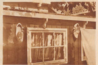
Holländische Holzbohle als Klammstühle. Man schenke das Bild als ein kleines Streichbild auf das freundliche Zürcher Gemein.