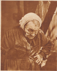
Die älteste Zürcherin. Sie ist 91 Jahre, wohnt allein in ihrem Hauschen, es nicht in einer Liebesnacht zu ihrem Sohn oder zu sonst jemandem zu bewegen. Die Unbilligkeiten in ihrem kleinen Gewohnheitsort geht ihr über alles.