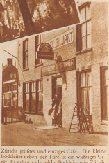
Zürichs größtes und einziges Café. Die kleine Backstube neben der Tür ist ein wahrgenommenes Café. Es stehen viele sehr frockelnde in Zürich. Jeden Sonntag brechen sie zum Ditteln auf, da wachen die Zürcher nämlich mit Wasen und Blumen ihre Häuser rein! Das ist die holländische sprechverdräbe Reintalken.