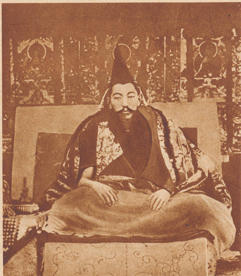
Ngawang Lopsang Tupden Gyatso

der eben verstorbene Dalai-Lama von Tibet. Er war 1876 geboren und stand seit 1893 als autonomer Herrscher an der Spitze dieses Kirchenstaates.