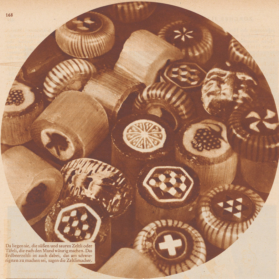
Da liegen sie, die süßen und sauren Zeltli oder Täfeli, die euch den Mund wässrig machen. Das Erdbeerzeltli ist auch dabei, das am schwierigsten zu machen sei, sagen die Zeltlimacher.