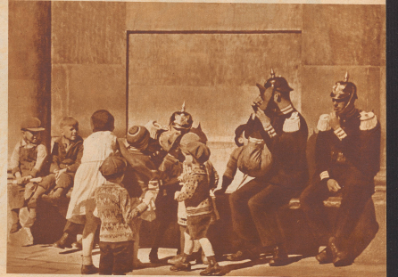
Rechts: Die Stadt auf dem harten Granit beherbergt sehr lebenswichtige Einwohner. Der schwedische Getreidereich ist unangenehm. Das natürliche Wohn der Schweden macht den Fremden die Aufenthalt in Stockholm selbst angenehmer. Selbst die Wälder am königlichen Schloss ist nicht in erster Linie erst und fern, sondern freundlich und kühlend.