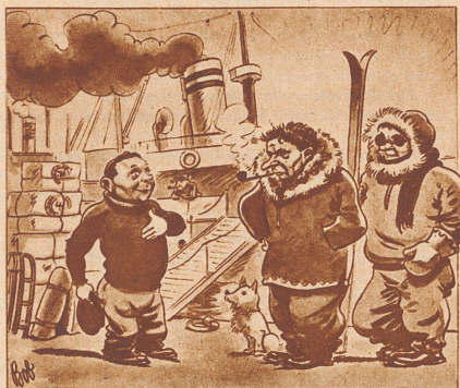
Vor der Abreise in die Arktis.

«Und Sie sind also mit allen Eisverhältnissen vollkommen vertraut?» «Aber gewiß, Herr Forscher, ich habe doch 10 Jahre in der Eisfabrik der Brauerei Hürlmann gearbeitet.»