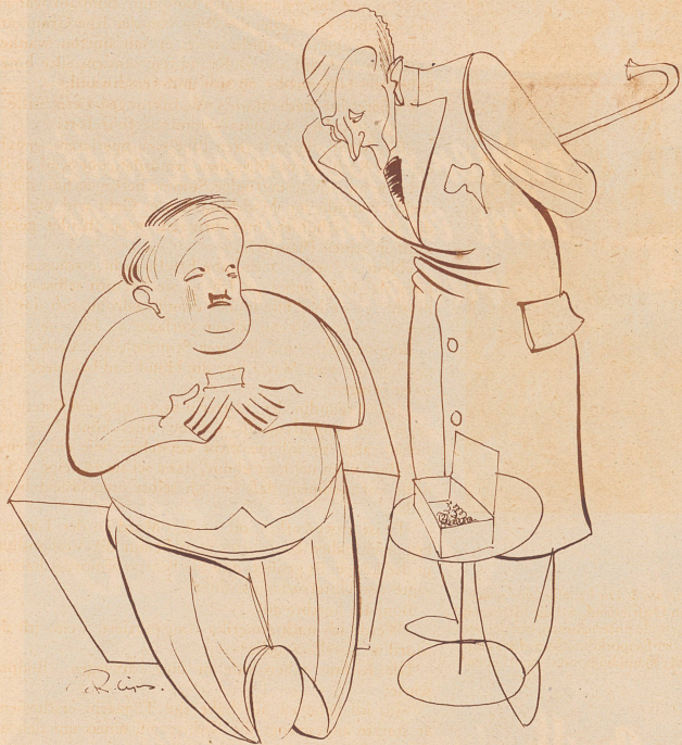
Zeichnung von R. Lips

«Denk dir, Kind, mit dem hab' ich ein enormes Geschäft gemacht. Ein Freund auf der Börse hat ihn mir für bare hundert Mark abgekauft.»