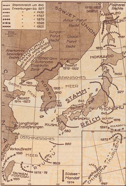
Wachstumsübersicht des japanischen Reiches vom Jahre 645 bis 1932