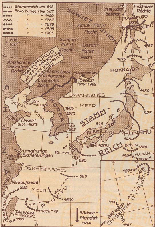
Wachstumsübersicht des japanischen Reiches vom Jahre 645 bis 1932