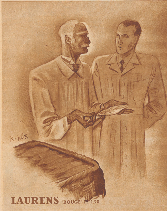
LAURENS "ROUGE" N. 120

«Nachher kamen die anderen Blumen an die Reihe. Ich hab hübsche Sträuße gebunden . . . schlug sie in Seidenpapier und trug sie von Zimmer zu Zimmer. Heimlich . . . es hat mich kein Mensch dabei gesehen. Später