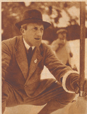
Sir Percy Bates

der englische Flieger und Besieger des Mount Everest im Flugzeug, in Begleitung seiner Mutter bei einer Ausfahrt in Arosa.