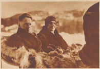
Gustav Fröhlich der beliebte Filmstar, verbrachte seine Ferien in St. Moritz.

Kleine Revue berühmter ausländischer Gäste der Winter-Saison 1933/34 auf Schweizer Kur- und Sportplätzen