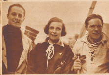
Leni Riefenstahl ebenfalls bekannt als charmante Filmschauspielerin wie als ausgezeichnete Skifahrerin, erntet Wintererfolge in Italien.

Kleine Revue berühmter ausländischer Gäste der Winter-Saison 1933/34 auf Schweizer Kur- und Sportplätzen