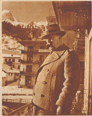
Dr. Hugo Eckener