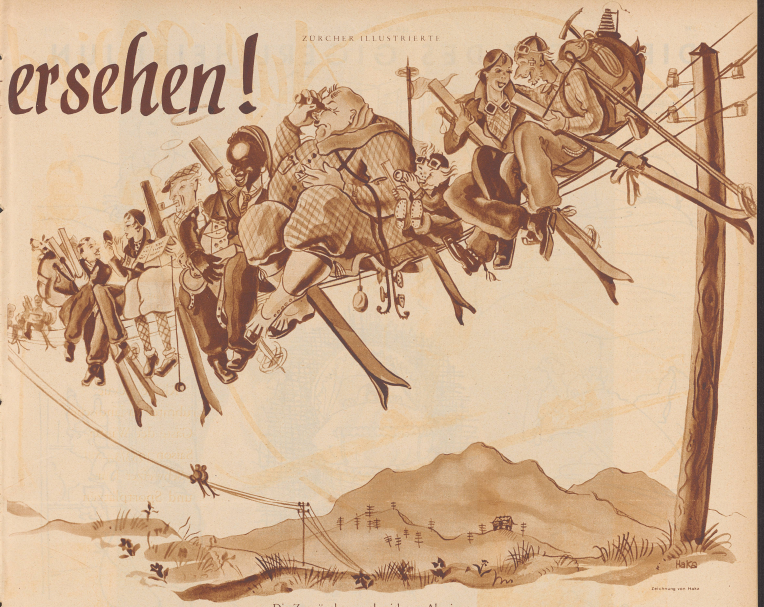
Die Zugvögel sammeln sich zur Abreise.

wählten für ihren diesjährigen Wintererholungsurlaub das idyllische Dörfchen Unterwasser im Toggenburg.