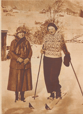
Die Königin der Niederlande und die Kronprinzessin Juliana

der bekannte deutsche Luftschiffer und Führer des Graf Zeppelin, im vor einigen Jahren ein ständiger Feriengast in Davos.