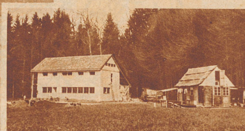
Ein Haus wird gebaut.

Am Greifensee war ein Haus zu bauen. Der winterlichen Witterung wegen waren die Arbeiten hinausgeschoben worden, bis es längst zu spät schien; doch die Einweihung mußte unbedingt im Mai vor sich gehen. Wer hilft aus der Verlegenheit? Die «Schwererziehbaren»! Sie haben es geschafft: am 7. März begonnen, am 13. Mai eingeweiht, ein Haus im Versicherungswert von Fr. 25 000. Sie arbeiteten dabei wie im Rausch, und als ein Lastwagenführer ihnen einmal zu wenig rasch Material führen wollte, da wurde er beinahe gelyncht. In dem zerlegbaren luftigen Häuschen nebendran wohnten sie während dieser Zeit.