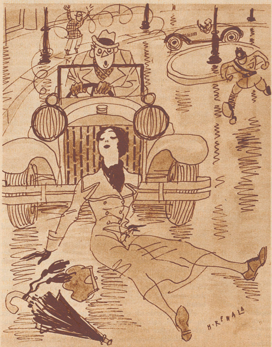
«Der erste Mann, der um mich anbält.»

Dienst am Kunden. Fremder: «In dem Prospekt Ihres Hotels ist auch ein «Fahrstuhl» erwähnt; ich kann ihn aber nirgends entdecken.» — Portier: «Ja, mit dem wird jetzt unser Direktor im Garten umhergefahren, er ist nämlich gichtleidend.»