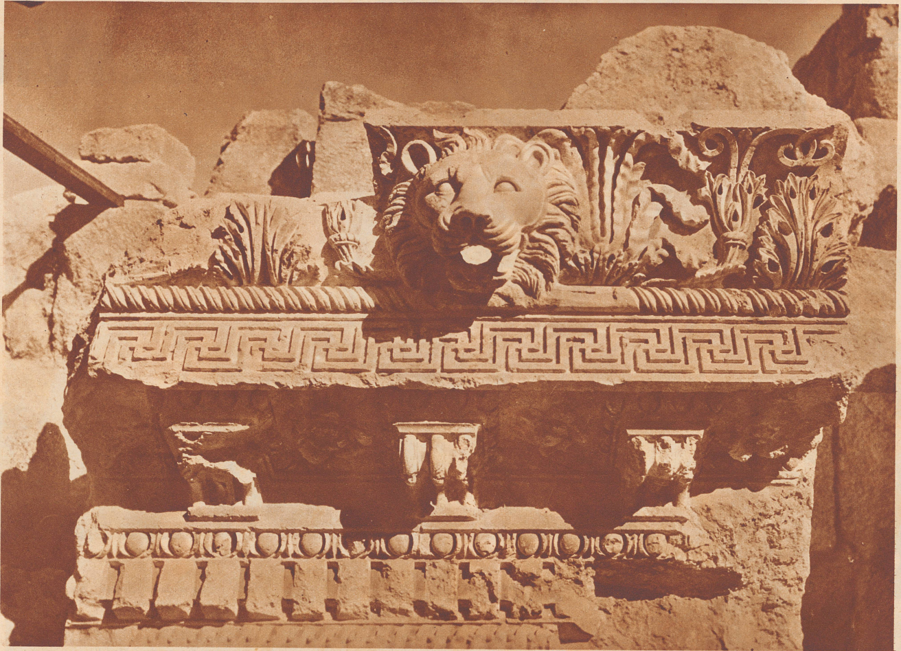
Gesims-Fragment an der Südseite des Großen Tempels von Baalbek. Das Bild gibt einen Eindruck von der reichen Ornamentik dieser monumentalen Architektur.