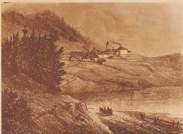
St. Moritz-Dorf vom Bad aus gesehen, nach einem Stich aus dem Jahre 1836.

Baden. Schon der römische Geschichtsschreiber Tacitus hat die Bäderstadt Baden an der Limmat erwähnt. Funde von Tempelüberresten, Münzen und zahlreichen medizinischen Instrumenten zeugen dafür, daß Baden bereits zur Römerzeit der weitaus wichtigste Badeplatz diesseits der Alpen war. Baden besitzt 17 aktive Chlornatrium-Schwefelquellen von 48 Grad Celsius, deren Anwendung sich besonders bei Stoffwechselkrankheiten, Rheumatismen, Gicht, Ischias, Katarhen und Bewegungsstörungen bewährt. Badens Ruhm ist zu jeglichen Zeiten und von Dichtern aller Nationen in die Literatur eingegangen. Was über Baden gesagt werden konnte, hat der Zürcher Dichter David Heß in seinem berühmten Buche «Die Badenfahrt» zusammengefaßt. Und über das heutige Baden berichtet Hermann Hesse in seinen einzigartigen Aufzeichnungen: «Der Kurgast».