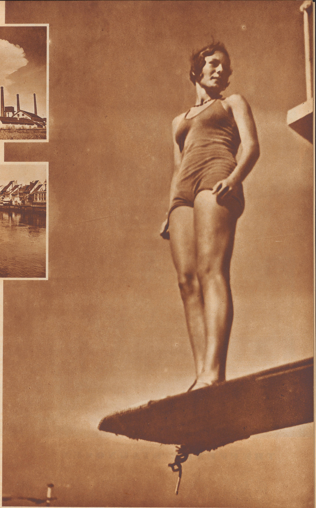
Rheinfelden beherbergt nicht allein Kranke; in seinem modernen Strandbad tummeln sich auch hübsche Badenixen.

Schinznach. Das aargauische Schwefelbad Schinznach, dessen Quellen zu den stärksten radioaktiven Schwefelquellen des Kontinents gezählt werden, liegt in der Nähe der Aare, inmitten eines großen Naturparks. Es sind in der Mehrzahl Hautleidende, denen die Schinzbacher Quellen Heilung von ihren oft nicht schmerzhaften, aber langwierigen Leiden bringen. Auch Stoffwechselkrankheiten, Drüsen- und Knochenkrankungen werden in Schinznach gepflegt und geheilt. Das Bad ist nicht nur eine ideale Heilstätte, sondern bietet Gelegenheit zu Golf- und Tennisturnieren, zu prächtigen Spaziergängen und Ausflügen zu Pferd.