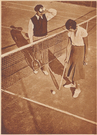
Flirt auf dem Tennisplatz des Schinzbacher Bades.

Schinznach. Das aargauische Schwefelbad Schinznach, dessen Quellen zu den stärksten radioaktiven Schwefelquellen des Kontinents gezählt werden, liegt in der Nähe der Aare, inmitten eines großen Naturparks. Es sind in der Mehrzahl Hautleidende, denen die Schinzbacher Quellen Heilung von ihren oft nicht schmerzhaften, aber langwierigen Leiden bringen. Auch Stoffwechselkrankheiten, Drüsen- und Knochenkrankungen werden in Schinznach gepflegt und geheilt. Das Bad ist nicht nur eine ideale Heilstätte, sondern bietet Gelegenheit zu Golf- und Tennisturnieren, zu prächtigen Spaziergängen und Ausflügen zu Pferd.