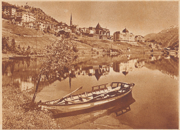
100 Jahre später. St. Moritz-Dorf und sein Gesicht heute.