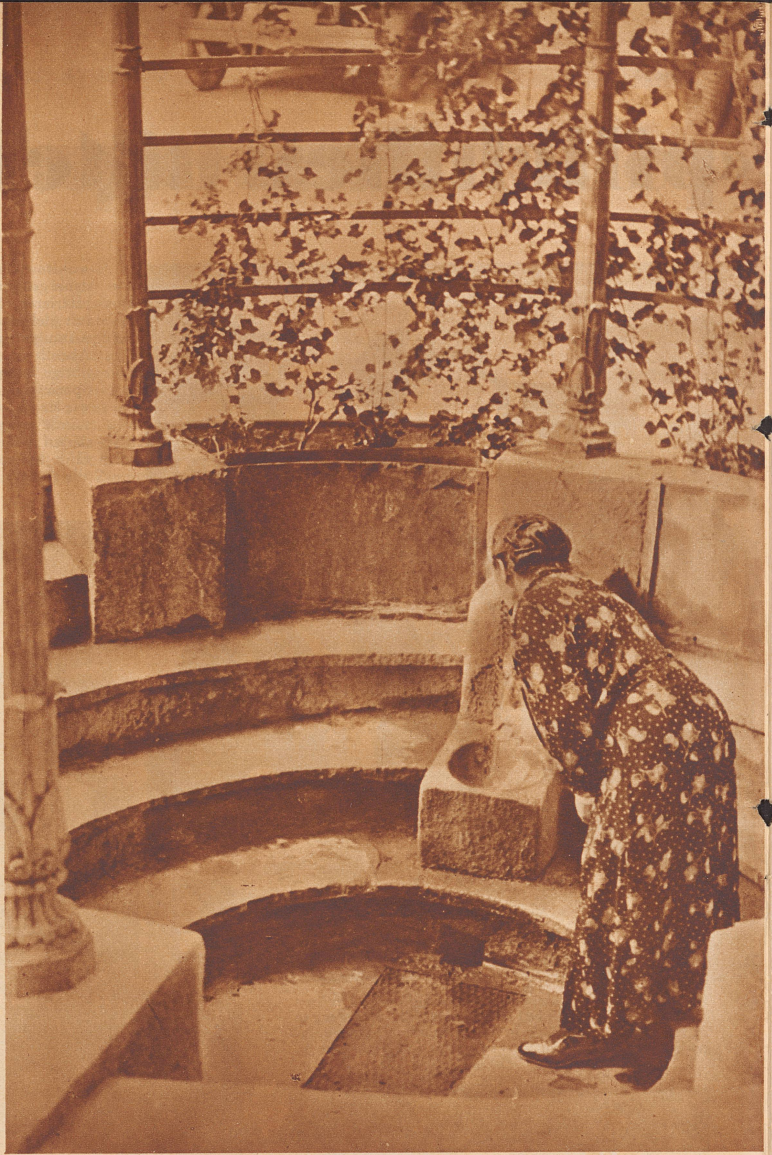
Das «Schwefelbrünnel» in Baden, eine öffentliche Quelle, an der jedermann im Vorübergehen einen Schluck des heilkräftigen Schwefelwassers trinken kann.

Baden. Schon der römische Geschichtsschreiber Tacitus hat die Bäderstadt Baden an der Limmat erwähnt. Funde von Tempelüberresten, Münzen und zahlreichen medizinischen Instrumenten zeugen dafür, daß Baden bereits zur Römerzeit der weitaus wichtigste Badeplatz diesseits der Alpen war. Baden besitzt 17 aktive Chlornatrium-Schwefelquellen von 48 Grad Celsius, deren Anwendung sich besonders bei Stoffwechselkrankheiten, Rheumatismen, Gicht, Ischias, Katarhen und Bewegungsstörungen bewährt. Badens Ruhm ist zu jeglichen Zeiten und von Dichtern aller Nationen in die Literatur eingegangen. Was über Baden gesagt werden konnte, hat der Zürcher Dichter David Heß in seinem berühmten Buche «Die Badenfahrt» zusammengefaßt. Und über das heutige Baden berichtet Hermann Hesse in seinen einzigartigen Aufzeichnungen: «Der Kurgast».