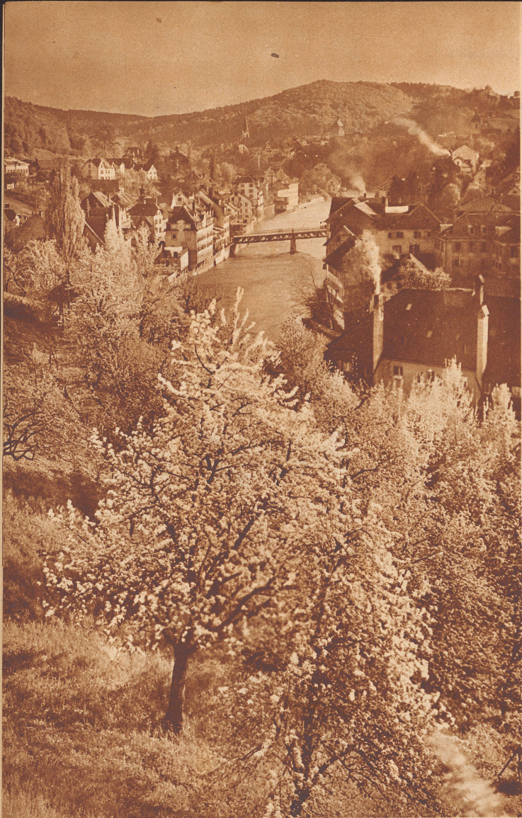
Blick auf die Bäderstadt Baden.