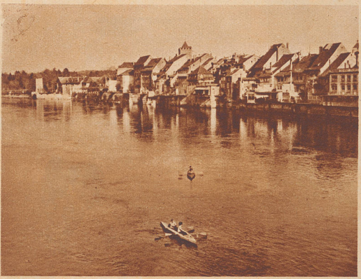
Rheinfelden, vom Rheine aus gesehen, besitzt ein ganz mittelalterliches Gesicht.