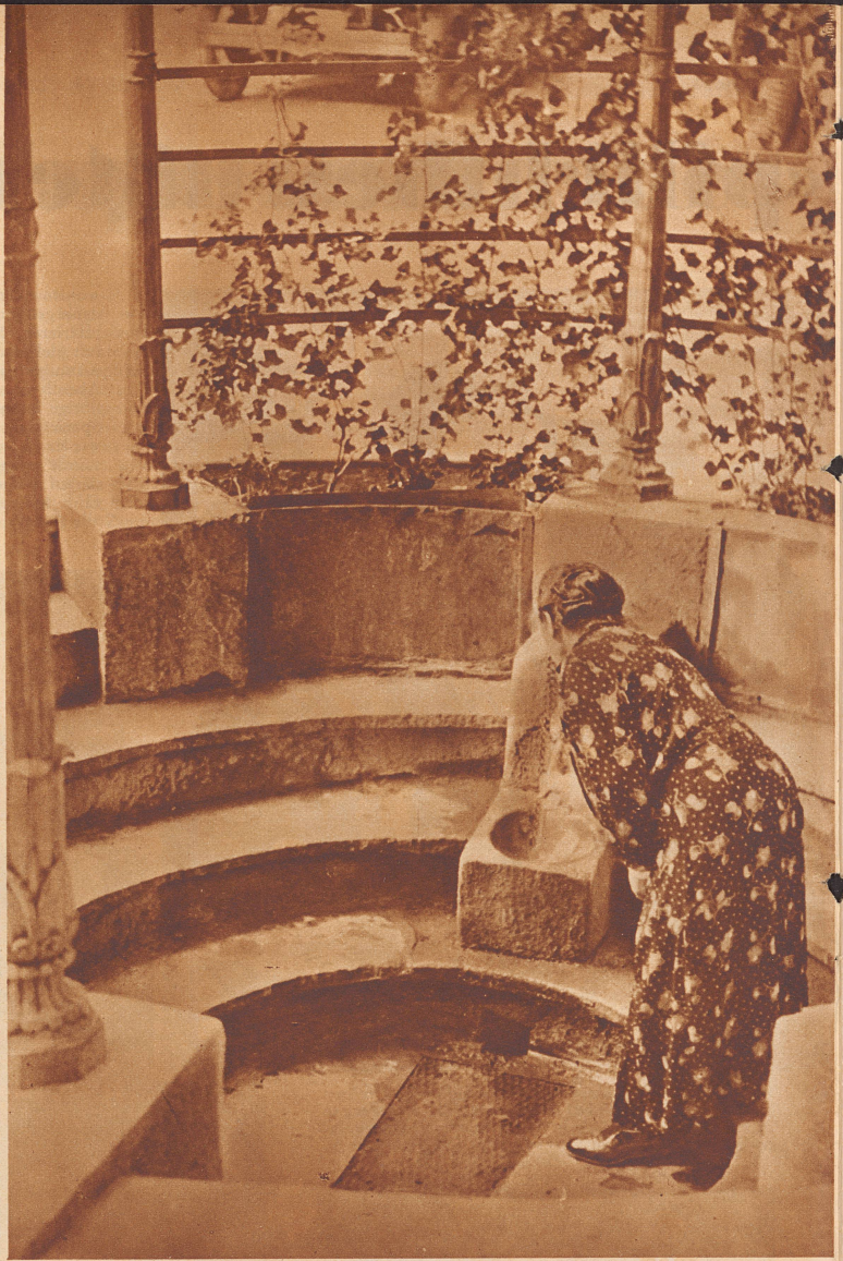
Das «Schwefelbrünnel» in Baden, eine öffentliche Quelle, an der jedermann im Vorübergehen einen Schluck des heilkräftigen Schwefelwassers trinken kann.

Baden. Schon der römische Geschichtsschreiber Tacitus hat die Bäderstadt Baden an der Limmat erwähnt. Funde von Tempelüberresten, Münzen und zahlreichen medizinischen Instrumenten zeugen dafür, daß Baden bereits zur Römerzeit der weitaus wichtigste Badeplatz diesseits der Alpen war. Baden besitzt 17 aktive Chlornatrium-Schwefelquellen von 48 Grad Celsius, deren Anwendung sich besonders bei Stoffwechselkrankheiten, Rheumatismen, Gicht, Ischias, Katarhen und Bewegungsstörungen bewährt. Badens Ruhm ist zu jeglichen Zeiten und von Dichtern aller Nationen in die Literatur eingegangen. Was über Baden gesagt werden konnte, hat der Zürcher Dichter David Heß in seinem berühmten Buche «Die Badenfahrt» zusammengefaßt. Und über das heutige Baden berichtet Hermann Hesse in seinen einzigartigen Aufzeichnungen: «Der Kurgast».