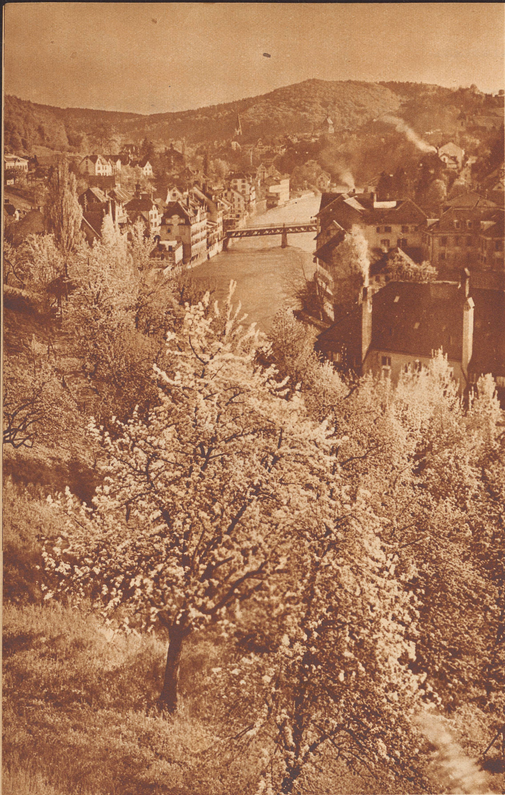
Blick auf die Bäderstadt Baden.