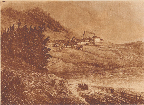
St. Moritz-Dorf vom Bad aus gesehen, nach einem Stich aus dem Jahre 1836.

Baden. Schon der römische Geschichtsschreiber Tacitus hat die Bäderstadt Baden an der Limmat erwähnt. Funde von Tempelüberresten, Münzen und zahlreichen medizinischen Instrumenten zeugen dafür, daß Baden bereits zur Römerzeit der weitaus wichtigste Badeplatz diesseits der Alpen war. Baden besitzt 17 aktive Chlornatrium-Schwefelquellen von 48 Grad Celsius, deren Anwendung sich besonders bei Stoffwechselkrankheiten, Rheumatismen, Gicht, Ischias, Katarhen und Bewegungsstörungen bewährt. Badens Ruhm ist zu jeglichen Zeiten und von Dichtern aller Nationen in die Literatur eingegangen. Was über Baden gesagt werden konnte, hat der Zürcher Dichter David Heß in seinem berühmten Buche «Die Badenfahrt» zusammengefaßt. Und über das heutige Baden berichtet Hermann Hesse in seinen einzigartigen Aufzeichnungen: «Der Kurgast».