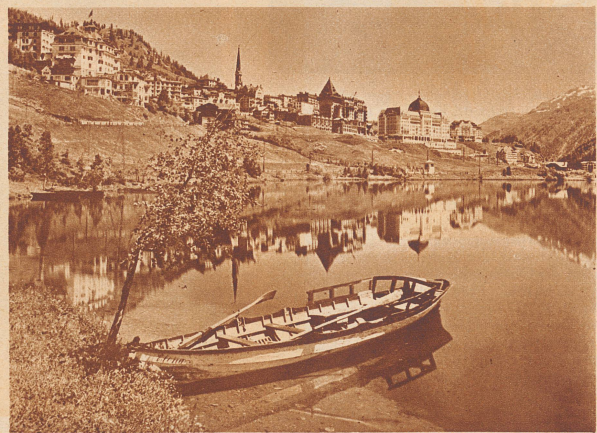
100 Jahre später. St. Moritz-Dorf und sein Gesicht heute.