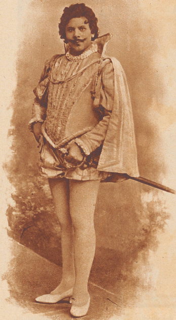
Wilhelm Bockholt als «Don Juan» im Jahre 1905