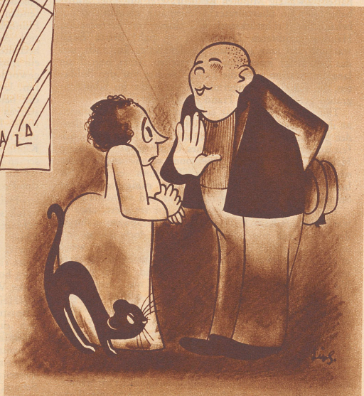
Zeichnung von R. Lips