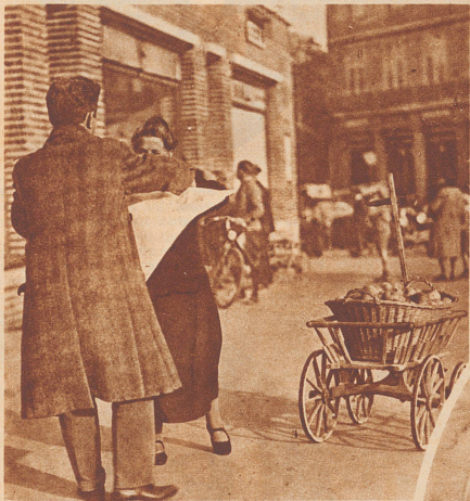
Ein Windstoß hat die Zeitung vom Kartoffelwägelchen fortgeweht, über die Straße. Viele sehen's und sehen die Frau, die etwas ratlos dem fortgeflogenen Blatt nachguckt. Soll sie ihm nachlaufen, soll sie nicht? Da hebt es schon ein junger Mann auf und bringt's zurück. Ein paar Leute hatten die gleiche Regung empfunden und sie nicht ausgeführt. Eine kleine Auffälligkeit war damit verbunden. Die haben sie nicht gewagt! — Habt den Mut, zu euren guten Regungen zu stehen!