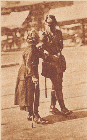
Der Polizeibeamte geleitet ein altes Weiblein über die Straße. Es ist keine von den glänzendsten Aufgaben, von denen, die viel Ehre bringen. Vielleicht gehört sie zu seinen Pflichten, vielleicht nicht. Möglicherweise fällt er mit seinem Tun aus der Reihe, vielleicht fällt er auf; ein wenig komisch sieht er aus in Lack und Glanz mit dem unscheinbaren alten Weiblein am Arm. Aber er kümmert sich nicht darum. Mur im Allerkleinsten! Wir haben ihn durchaus nicht immer.