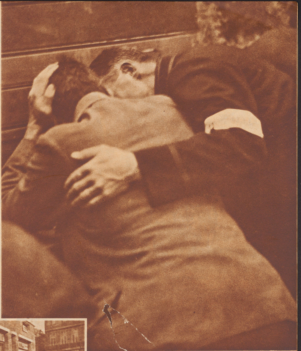
Die ermutigende Gebärde. Welch schöne, kräftigende, wahrhaft menschliche Bewegung! Die Hand auf der Schulter des Verzweifelten. Bei welcher Gelegenheit dieses Bild aufgenommen wurde? Darnach fragen wir nicht. Das tut nichts zur Sache, es steht als Aufruf an diesem Platze, zur Mahnung: Seid Ermutiger!

Ein Kind kommt aus der Schule. «Wie ging's?» fragt die Mutter. «Schlecht», sagt die Kleine, «wir hatten Geographie, da sagte der Lehrer, es leben 1500 Millionen Menschen auf der Erde, aber ich sei die Dümme». Ermutigend, nicht wahr? Wir sind ihm alle im Leben begegnet, dem Lehrer, dem Onkel, dem Vorgesetzten, überhaupt jenem Mitmenschen, der uns für einen Fehler nicht nur tadelte, sondern mit einer gewissen Freude in die tiefste Mutlosigkeit hineinstieß. Unsere Verachtung allen denen, die's aufs Entmutigen abgesehen haben und unsere Liebe und Achtung allen, denen es ums Ermutigen zu tun ist! Ein ermunterndes Wort zur rechten Zeit ist ein köstliches Geschenk, da braucht ein jeder nur an seine Jugend und Werdezeit zu denken. Drum setzen wir vor alle Großtaten des Mutes diese vier Bilder, sie reden vom köstlichsten Mut, den es gibt, — vom Lebensmut. Es ist nicht jedermanns Sache, noch ist jedem im Leben Gelegenheit gegeben, weithin sichtbare Mut-Taten zu vollbringen, aber ein Ermutiger zu sein, wo's nottut, das kann jeder, das ist ein ehrenwertes Werk und trägt wunderbare Früchte.