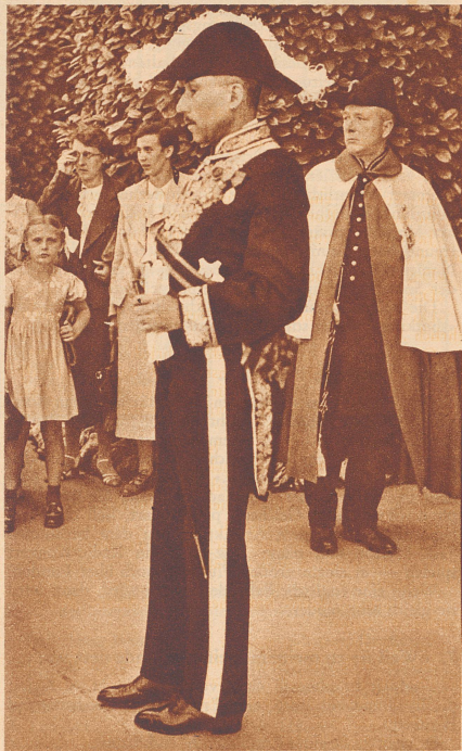
Graf Louis d'Ursel, Gesandter von Belgien