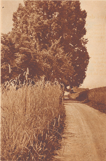
Eine Aufnahme kann nur Formen und Tönungen zeigen, den satten Glanz der goldenen Aehrenfelder, das Blau des Himmels und das innige Grün der Linden können nur Wanderer dort oben auf dem Ballenbühl genießen.