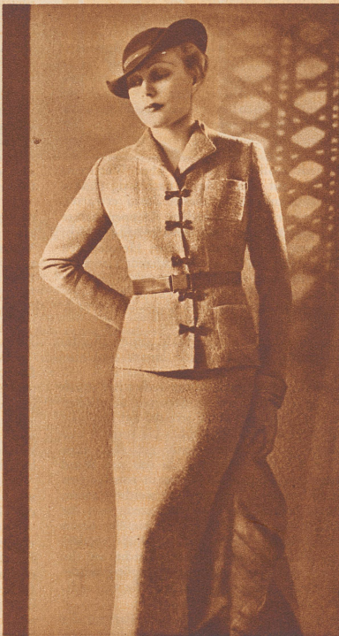
Kostüm aus grünem Wollstoff, mit einem Verschluss von schwarzen Haften.