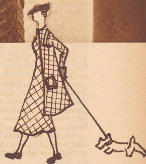
Ein vornehm wirkendes Besuchs- kleid aus braunem Jersey, mit großen, grünen Holzknöpfen.