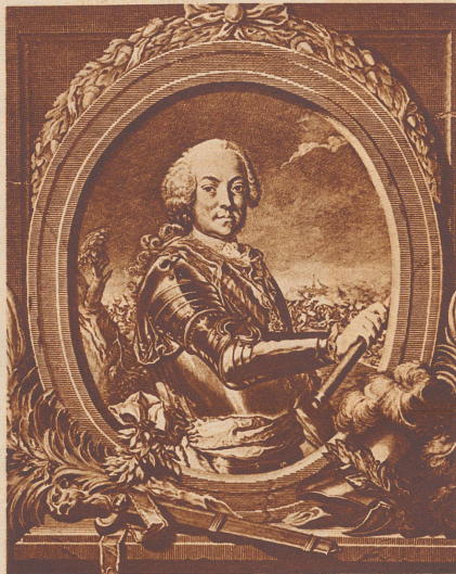
Der erste Träger des Maria-Theresia-Ordens, Graf Leopold Daun. Er bekam die Auszeichnung am 18. Juni 1757, am Tage der Schlacht bei Kolin.

Wie merkwürdig ist nun angesichts dieses Beispiels, daß das selbe Oesterreich, das mit dieser Unerbittlichkeit das Herkommen und die Ueberlieferung zu verteidigen wußte, die einzigartige Einrichtung des Maria-Theresia-Ordens besaß. Die Kaiserin Maria Theresia gründete den Orden, nachdem einer der jüngeren Offiziere ihrer Armee einen Sieg «vorschriftswidrig» errungen hat. Weil er sich gegen die Disziplin verging, hätte er erschossen werden sollen. Weil er die Gesamtlage der kaiserlichen Armeen wesentlich verbessert hat, mußte er ausgezeichnet werden. Aus diesem Dilemma heraus entstand nun der Maria-Theresia-Orden, dessen Ritter nur solche Angehörige der Armee sein können, die einen Sieg heimbringen, indem sie sich gegen den höheren Befehl vergehen.