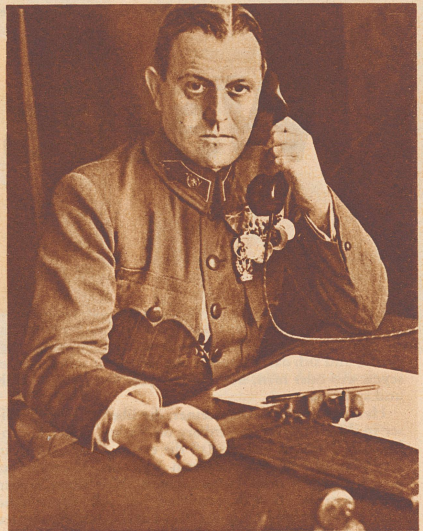
Der bis heute letzte Träger des Maria-Theresia-Ordens, der österreichische Bundesminister General Emil Fey. Er verdiente sich die Auszeichnung im Weltkriege an der Isonzofront.