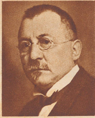
† Alt Regierungsrat Wilhelm Plattner

langjähriger Stadtrat von Chur, Großrat und 1918 bis 1926 Mitglied der Regierung von Graubünden, starb 67 Jahre alt.