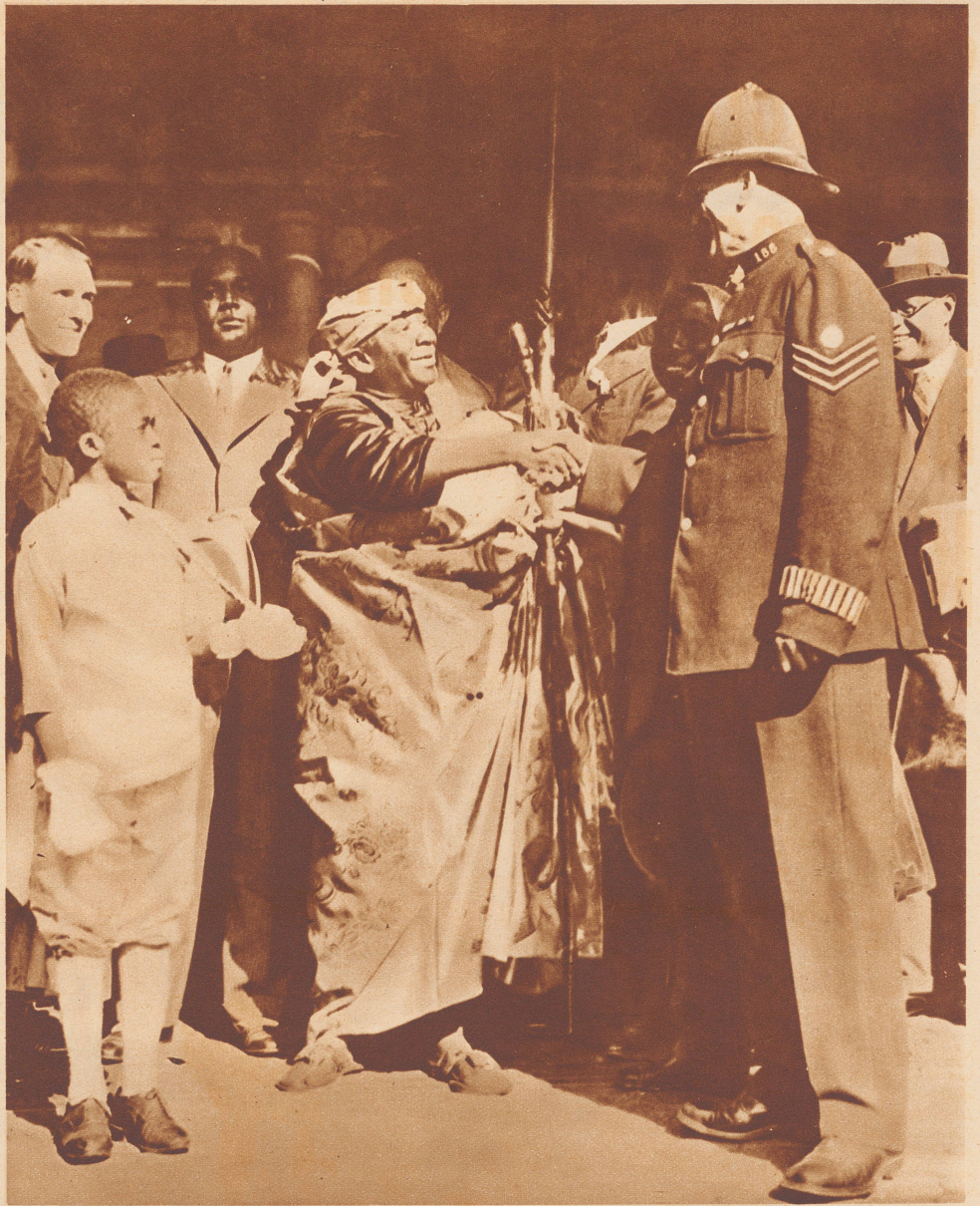
Nana Sir Ofori Atta , der mächtigste Herrscher an der Goldküste, war auf Besuch in London. Nun begibt er sich in sein Reich zurück. Der Londoner Polizist am Euston-Bahnhof erhält den letzten königlichen schwarzen Abschieds-Händedruck.