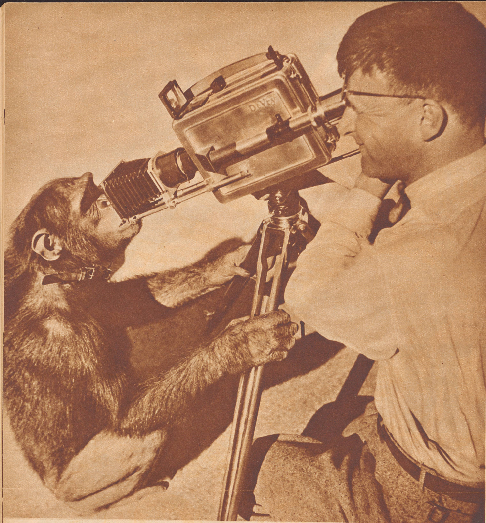
Ein «gwundriger» Filmstar