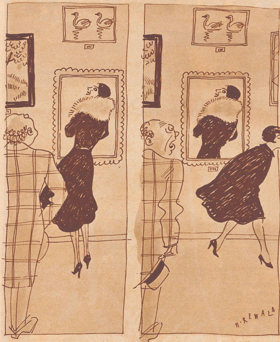
Kleiner Irrtum in der Ausstellung

Der Pedant. Am Postschalter: «Hier auf der Anweisung haben Sie einen I-Punkt vergessen.» «Ach bitte, setzen Sie ihn doch hin!» «Bedauere, es muß dieselbe Handschrift sein.»