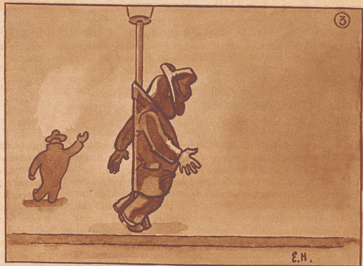
Wahre Begebenheit aus der Sauserzeit