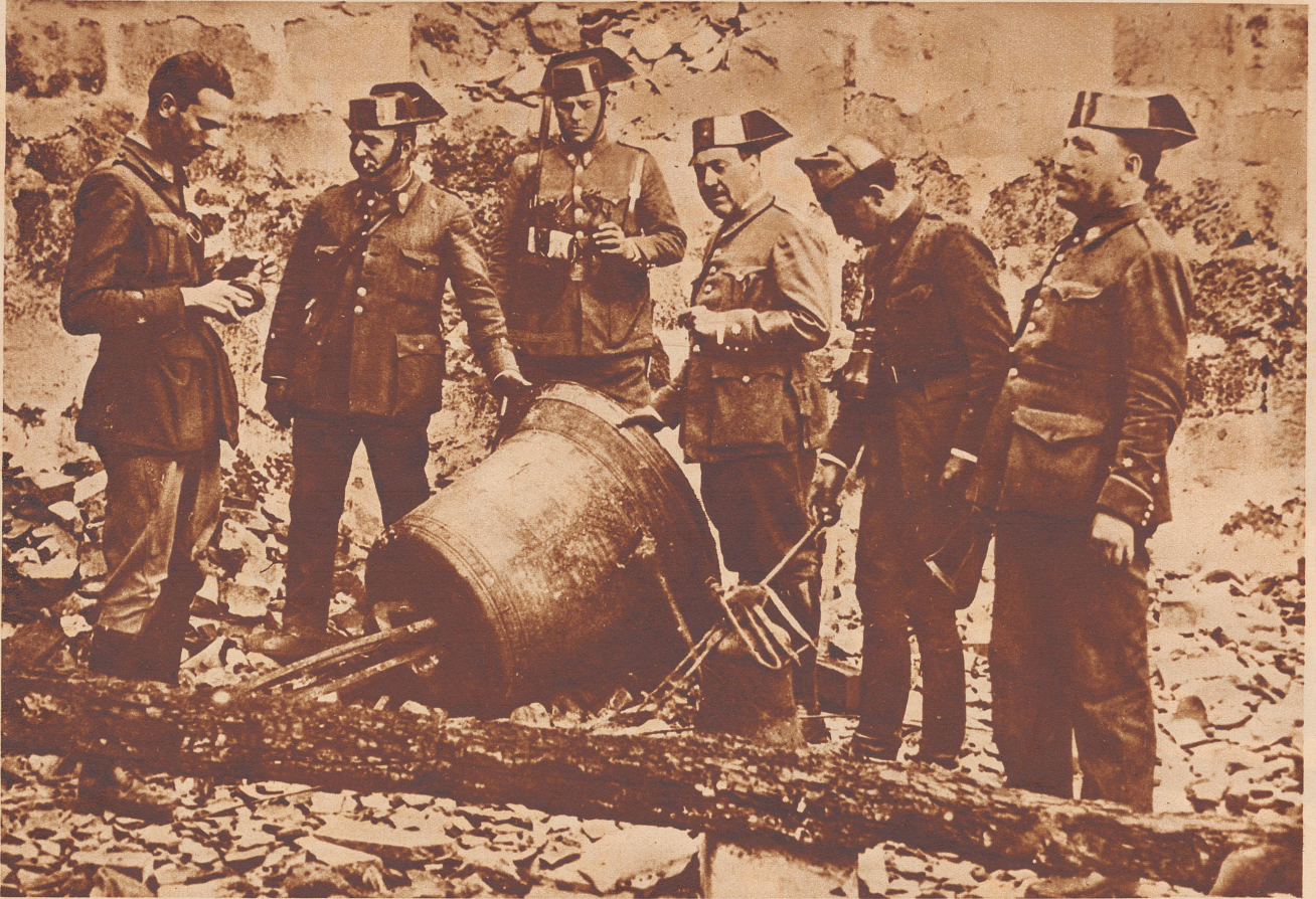
Die zusammengeschossene Kirche. Im Dorfe Las Branoseras bei Oviedo stürzte die Kirche infolge der Beschießung durch die Regierungstruppen ein.