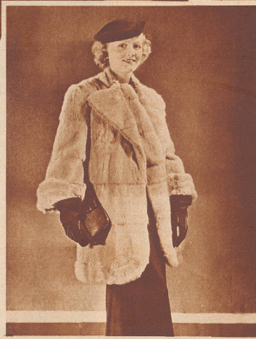
Eine dreiviertellange Jacke aus Feh. Sie kann zum Ausgangskleid, aber auch als Hülle zum Abendkleid getragen werden.

Pelz auch am Abendkleid. Langhaarige Pelze werden mit Vorliebe als Schulter- oder Décolletébesatz an Festkleidern angebracht. Sie lassen die langgezogenen Linien der Abendkleider weniger streng und herb erscheinen.