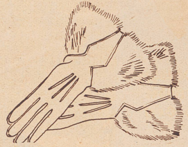
Zeichnungen Margret Bruner

zwischen Handtasche und warmer Hülle. Die netten, kleinen Pelzmützen, unter denen sich schon die «Löckchen unserer Großmütter neckisch hervorringleten», sind wieder erstanden. Rundliche Gesichter sollen sich aber vor ihnen hüten. Einen recht eleganten und auch praktischen Abschluß an Mänteln und Kleidern bildet die Pelzschleife. Manchmal findet sie ihre Ergänzung in den Pelzstulpen der Handschuhe.