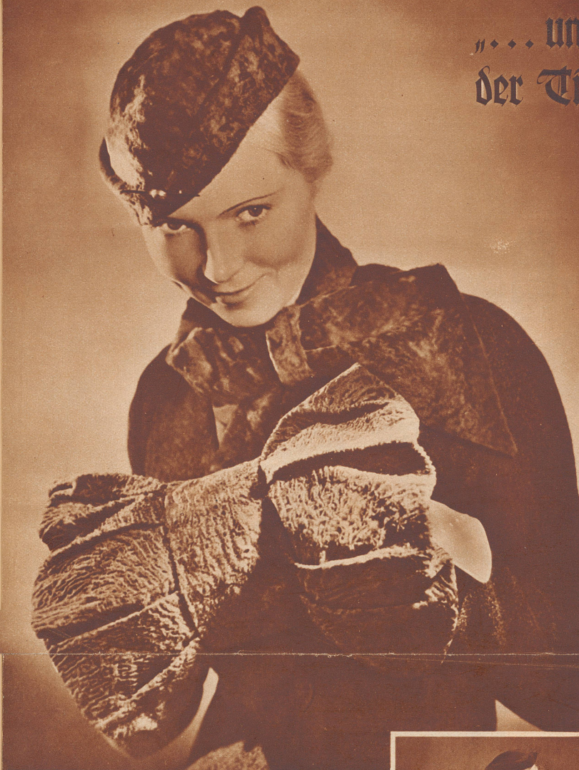
Pelzkappe, Muff und der schleifenartige Mantelkragen sind aus Breitschwanz.