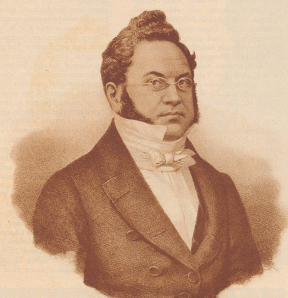
Daniel Henri Druey

Zürich, geb. 1805, gest. 1861. Bundesrat von 1848 bis 1861. Bundespräsident in den Jahren 1849, 1852, 1855, 1858.