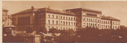
Das von Fr. Studer 1852 bis 1856 erbaute «Bundeshaus», der sogenannte heutige Weinhof. Er wurde 1857 bezogen und war bis 1902 Sitz des Eidgenössischen Parlaments und des Bundeskanzlers. Seit 1902 beherbergt der Bau das Politische Departement, das Departement des Innern und das Justizdepartement.