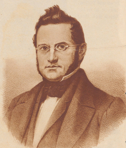
Dr. h. c. Jonas Furrer

Zürich, geb. 1805, gest. 1861. Bundesrat von 1848 bis 1861. Bundespräsident in den Jahren 1849, 1852, 1855, 1858.