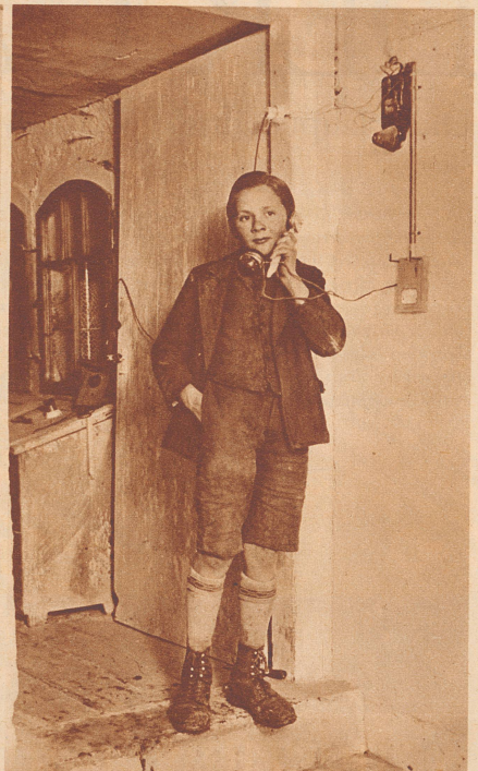
Das Telefon funktioniert. Man sieht es dem jungen Monteur an, wie er sich innerlich über die gelungene Arbeit freut.