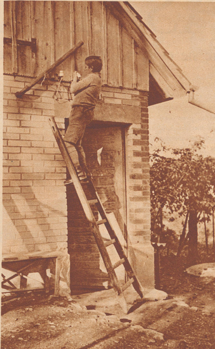
Am Hühnerstall selbst werden die Drähte nochmals um die Isolierzapfen gewickelt.