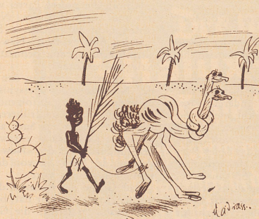
Der erfinderische Straußenhirt.