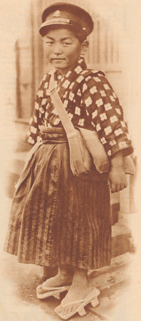
Ein japanischer Erstkläbler,

Ganz unglaublich ernst sind die kleinen Menschen Chinas und Japans. Die japanischen Kinder haben lange Gewänder an wie die Erwachsenen, aber bunter und farbenfreudiger; sie tragen schwere Holzsandalen, Geta genannt; die Sandalenriemen werden zwischen der großen und der zweiten Zehe durchgezogen. Vielleicht können sie deswegen nicht so schnell laufen und toben wie unsere Kinder. Kommen sie in die Schule, so müssen sie sich sehr mit dem Lesen und Schreiben plagen, denn es gibt im Japanischen keine Buchstaben für einzelne Laute wie bei uns, sondern nur für einzelne Silben. Ein Kind muß viele, viele Silbenzeichen auswendig können, bis es lesen kann. Es schreibt auch nicht mit Tinte, sondern mit Tusche (eine Art schwarze Farbe) und benützt dazu keine Feder, sondern einen Pinsel.