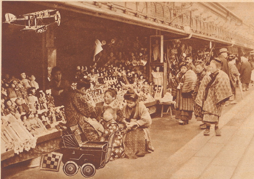
Der Puppenladen auf offener Straße.

Das Spielzeug der chinesischen und japanischen Kinder ist sehr hübsch und billig. Sie haben schön geschnittene Tiere aus Holz, bunte, farbige Bilderbücher. Wie bei uns spielen die Buben gern mit Soldaten, die Mädchen mit Puppen. Die Puppen ähneln entweder den unsrigen mit rosigen Gesichtern und Locken oder sie haben wie ihre kleinen Mütter glattes schwarzes Haar und geschlitzte Augen. Am 13. März, dem Fest der Mädchen, werden Puppenausstellungen veranstaltet, die Mädchen statten einander Besuche ab wie richtige Damen und besichtigen gegenseitig ihre Puppen. Vor dem 13. März machen daher die Puppenverkäufer, die, wie die anderen Kaufleute in Japan, ihre Waren in offenen Läden anbieten, recht gute Geschäfte.