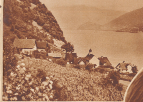
Im Nebel von Quinten. Die Quintener machen sich nicht sehr viel aus dem See. Sie steigen nicht hinaus, um zu baden oder zu schwimmen. Als Quintener, die sich im Malerigen Quintener-Wein verwehnt hätten, seien gelegentlich auf dem Heimweg im Wasser gefallen. Doch sei noch nie einer ertrunken. Darauf ist man sehr stolz.

Die älteren Mädchen des Dorfes ziehen meist in die «Ferne», das heißt in die übrige Schweiz, weit weg von ihrer Robinsoninsel. Auch die jungen Männer sind selten. Einer der Zurückgebliebenen vererbt den Boos-