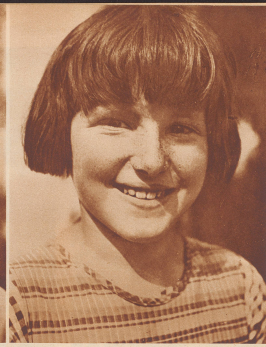
Romane vertritt, daß man die Quintener nicht etwa «Küchler» nenne wegen ihres Charakters.