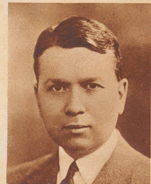
Professor Harold Clayton Urey von der Columbia-Universität in New York ist Chemie-Nobelpreisträger für 1934. Er hat sich den Preis durch seine Entdeckung des schweren Wasserstoffes verdient.