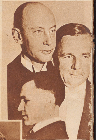
George R. Minot (oben) George H. Whipple (rechts) und William P. Murphy (unten), drei amerikanische Aerzte, teilen sich in den Medizin-Nobelpreis. Die drei Forscher verdanken die Auszeichnung einer höchst bedeutsamen Errungenschaft, an der sie alle in fast gleichem Ausmaße beteiligt sind; sie haben im abgelaufenen Jahrzehnt die Leberbehandlung der perniziösen Anämie begründet und durchgesetzt.