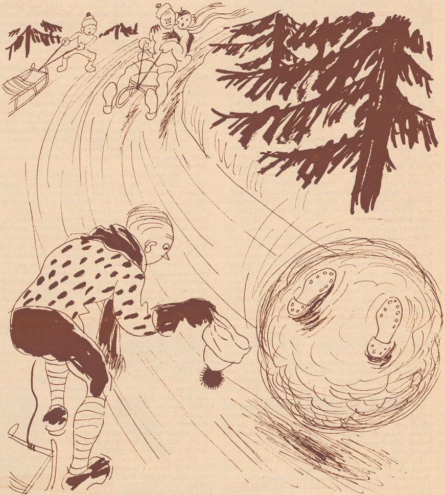
Begegnung mit dem Chef. «Guten Tag, Herr Direktor!»

Sie: «— jede-n-Abig gabsch du surt go jasse — ich packe jetzt mini Goffere und Jabre bei zur Mame!» Er: «Dänn gabn ich d'rwiel en Jaß go mache, bis d'packet häsch, gäll?!»