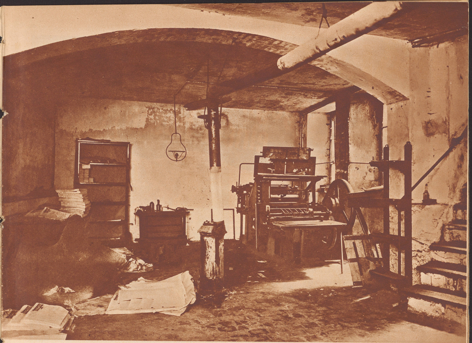
Das Innere einer ausgehobenen Fälscherwerkstatt, in der falsche Reichsbanknoten gedruckt werden.

die weitere Aufgabe zu, den eigentlichen Verausgaber «loszuweisen», wenn dieser in einem Laden mit einem Falschstück Anstand hat. Durch die Ladenscheibe beobachtet der dritte Mann von der Straße her, was in dem Geschäft vorgeht. Sobald er an dem drinnen zwischen dem Verkäufer und seinem Komplizen entstehenden Disput merkt, daß diesmal die Sache schief zu gehen beginnt, betritt er wie ein harmloser Käufer das Geschäft. Ohne erkennen zu lassen, daß er den Ausgeber des Falschstückes kennt, mischt er sich in das Gespräch, läßt sich das Falschstück zeigen und begutachtet es natürlich als echt. Er entdeckt ein Wasserzeichen, wo viel-