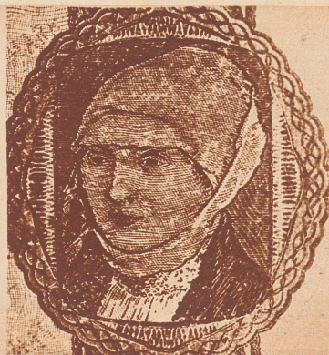
Kopfbild einer falschen Reichsbanknote zu 20 Reichsmark. Strich und Schraffur, namentlich die linearen Einzelheiten des Rahmens sind auffallend vergrößert und ungenau nachgeahmt.