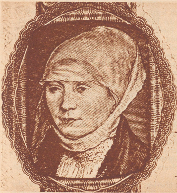
Kopfbild einer echten Reichsbanknote zu 20 Reichsmark.