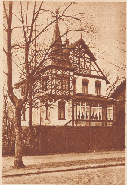
Die harmlose Fassade. Brav und bieder steht diese Villa eingereiht in eine Häuserzeile, wo unbescholtene Bürger mit solidem Tagesprogramm ihren Wohnsitz haben. Die Mieter aber haben in einem Kellerraum eine Falschmünzwerkstatt eingerichtet und prägten dort falsche 2-Markstücke, bis die Polizei das Nest ausnahm.