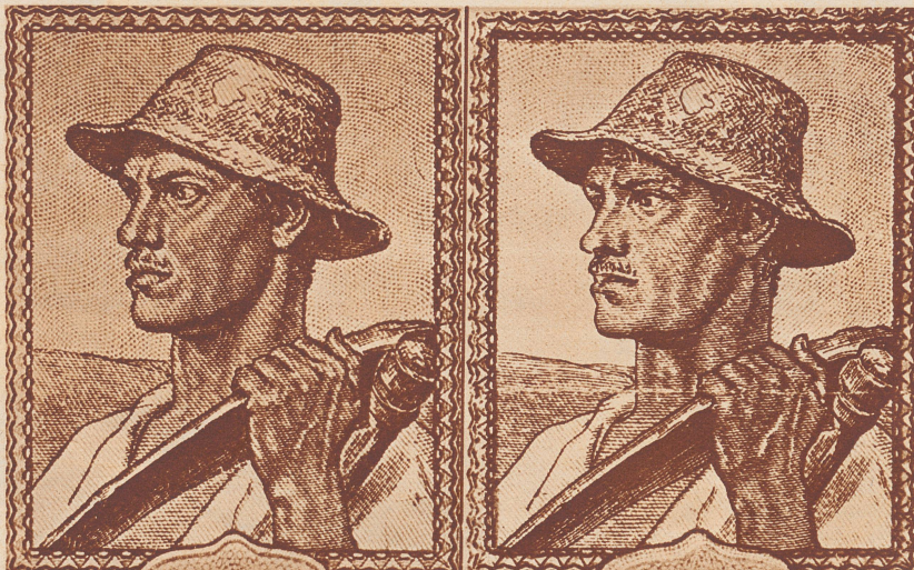
Kopfbild des echten 50-Rentenmarkscheines. Die Kinnbackenlinie verläuft von der Kinnschuppe nach unten. Die linke Halslinie verläuft von der Kinnschuppe nach unten. Ferner ist die linke Halslinie etwas nach außen gewölbt.