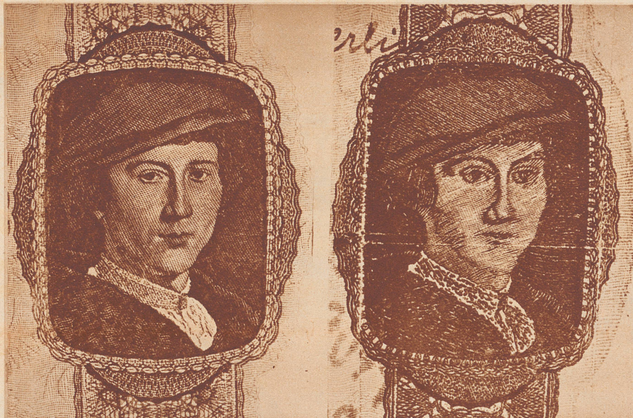
Kopfbild einer echten Reichsbanknote zu 10 Reichsmark.