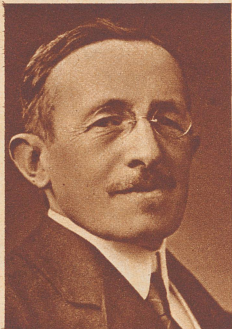
† Nationalrat Dr. Jean de Muralt ehemaliger waadtländischer Großrat, Gemeindepräsident von Montreux und Präsident des waadtländischen Anwalts- verbandes, starb 72jährig. Dem Nationalrat gehörte er seit 1925 als Vertreter der Liberaldemokraten an.

Aufnahme aus der 10. Zürcher Kantonal-Rad-Querfeldein-Meisterschaft vom 13. Januar in Wallisellen. Die Junioren nehmen eine steile Halde bei Rieden. Aus der Kategorie der Junioren ging Jos. Notter, Zürich, aus der Kategorie der Professionals und Amateure Emil Jäger, Zürich, als Sieger hervor.