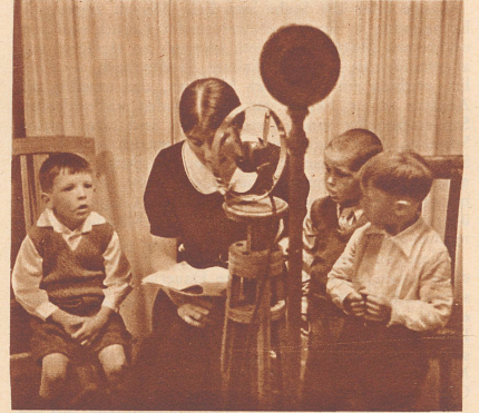
Die Kindertante erzählt am Radio eine Geschichte. Die kleinen Buben reden auch mit, sie fragen dies und jenes und wollen ganz genau Bescheid wissen.

sicher habt ihr schon zugehört, wenn im Radio Kinderstunde war. Vielleicht habt ihr dabei selber schon mitgemacht, denn es kommt ja viel vor, daß ganze Schulklassen am Radio singen, Gedichte auf-sagen oder auch sonst etwas erzählen. Wer weiß, ob nicht manche von euch dabei waren. Früher, als das Radio noch neu war, da hat immer ein Erwachsener in der Kinderstunde Geschichten erzählt.