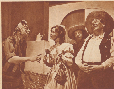
Lustspielpremiere im St. Galler Stadttheater