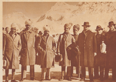
Indische Gäste in Arosa