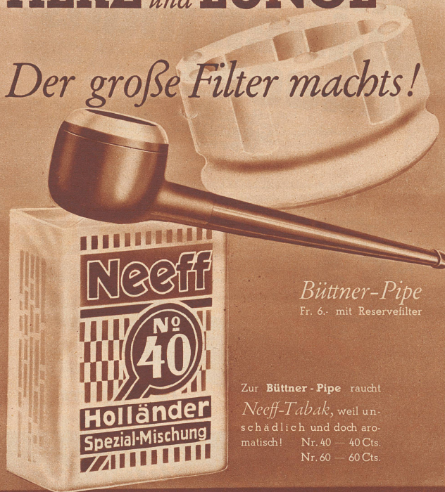
Böttner-Pipe Fr. 6.- mit Reservefilter

Zur Böttner-Pipe raucht Neeff-Tabak, weil un- schädlich und doch aro- matisch! Nr. 40 — 40 Cts. Nr. 60 — 60 Cts.