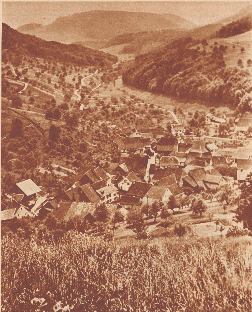
Vom Rhein bis zu den Jurahöhen laden die Gemeinden des Fricktals und seine Grenzorte zum Wandern ein. Muß es nicht verlocken, dem Ruf zu folgen? Bild: Maisprach mit Farnsborg.

Erscheinen zwanglos in der «Zürcher Illustrierten» • Alle für die Redaktion bestimmten Sendungen sind zu richten an die «Geschäftsstelle des Wanderbunds», Zürich 4, am Hallwylplatz