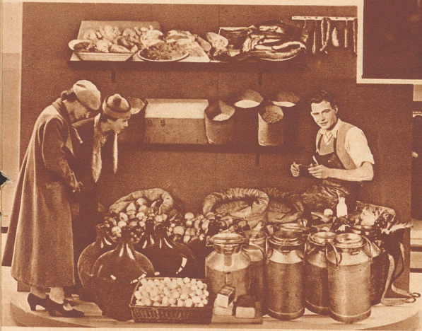
So viel verzehrt ein Mensch im Laufe eines Jahres.

Rechts: Wieviel Luft verbraucht der Mensch? Dieses Luftbedürfnis ändert sich je nach der Beschäftigung. Die Zahlen unter den Figuren geben den Luftverbrauch pro Minute an. Der Schläfer kommt mit 6,7 Liter aus, beim Sitzen und Gehen steigt das Luftverlangen des Körpers, der Bergsteiger braucht 33 Liter in der Minute, der Schwimmer sogar 43 Liter. Dies nicht nur deshalb, weil Schwimmen an sich die anstrengendere Bewegung wäre, sondern vor allem darum, weil die Hautatmung, die der Lunge einen Teil ihrer Arbeit abnimmt, im Wasser wegfällt.