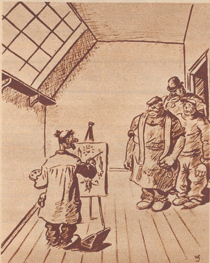
«Ist das hier richtig, wo die Möbel abgeholt werden sollen?»

«Ich will Ihre Tochter heiraten, und nicht kaufen.»